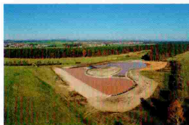
Der erste von drei Abschnitten des Kranichwoogs aus der Luft gesehen

• Natur und Umwelt: Ein phantastisches Naturprojekt ist der „Kranichwoog“. In Zusammenarbeit vieler Akteure entsteht in den Bruchwiesen ein Modell fürs ganze Land. Auch Aktivitäten der NSG „Moorklee“ und ebenso der Landwirte werde ich fördern. Dazu zählt auch der Hochwasserschutz.