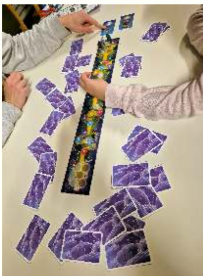
Kinder haben Spaß an guten Gesellschaftsspielen. Und am Miteinander.

„Warum nicht beispielsweise eine der bewährten Schnitzeljagden veranstalten? Mit wenig Aufwand, dafür mit riesen Spaß für Klein und Groß. Drau-