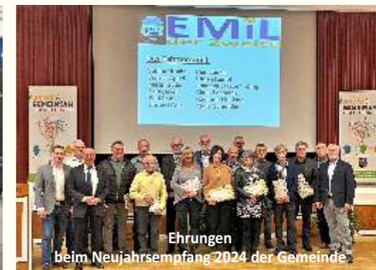
Ehrungen beim Neujahrsempfang 2024 der Gemeinde