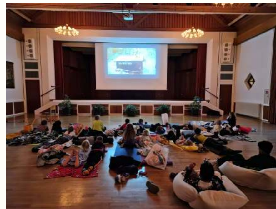
Das Weihnachtskino im Bürgerhaus Hütschenhausen war ein Riesenerfolg. Weitere Kinonachmittage sind bereits geplant.