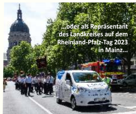
...oder als Repräsentant des Landkreises auf dem Rheinland-Pfalz-Tag 2023 in Mainz...