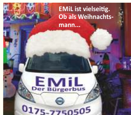
EMiL ist vielseitig. Ob als Weihnachtsmann...

Deshalb entschloss sich der Bürgerbusverein zum Erwerb eines neuen Fahrzeugs. Es ist ein wiederum voll-elektrischer Opel. Er hat automatisch ausfahrende Trittstufen, bietet größere Beinfreiheit, hat überall große Haltegriffe und insgesamt mehr Sitzplätze. Sein Name? Klar doch: EMiL der Zweite.