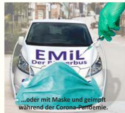
...oder mit Maske und geimpft während der Corona-Pandemie.