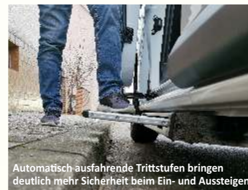
Automatisch ausfahrende Trittstufen bringen deutlich mehr Sicherheit beim Ein- und Aussteigen