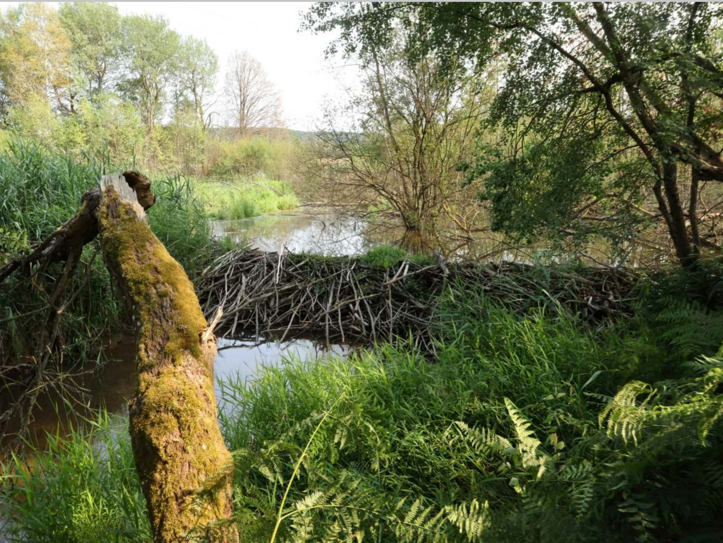
Mächtiger Biberdamm im Reichswald