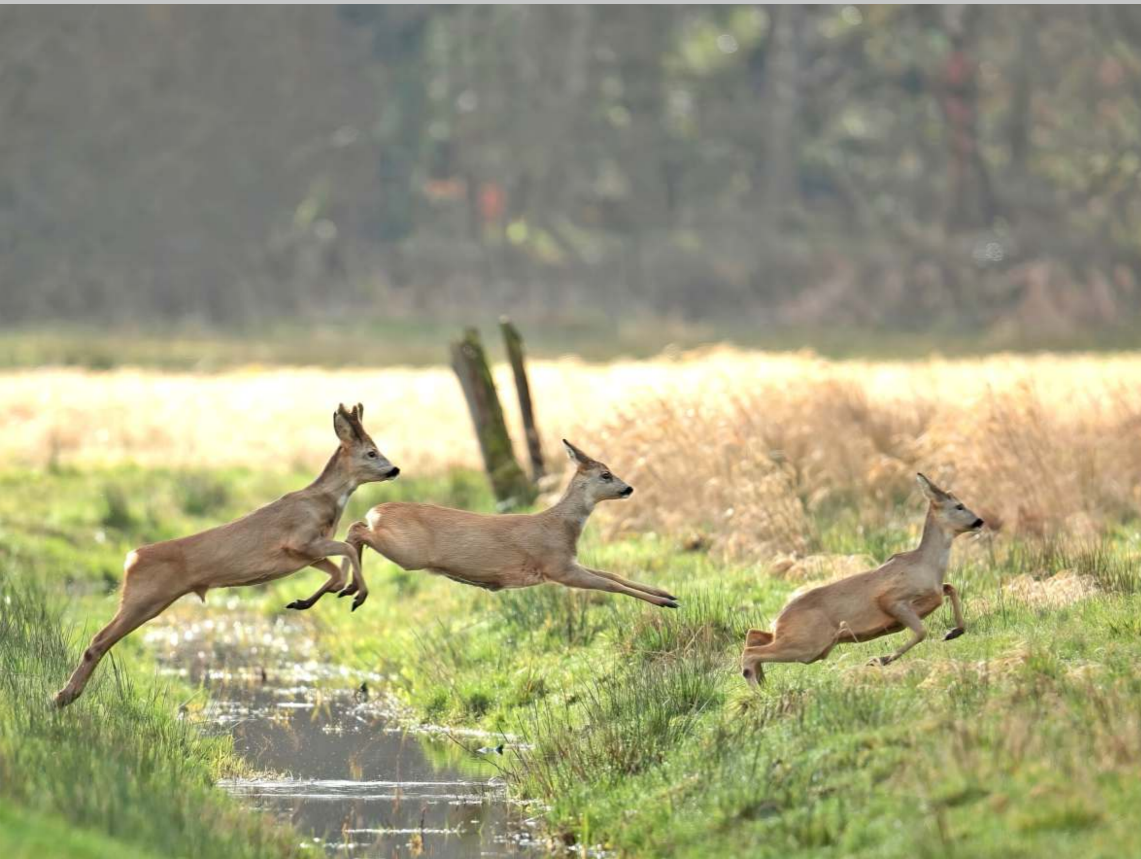
Rehe im Bruch