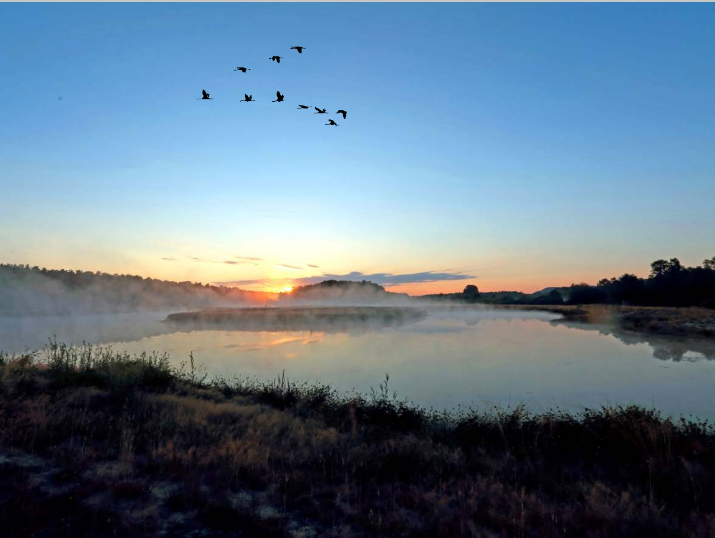
Kranichwoog bei Sonnenaufgang