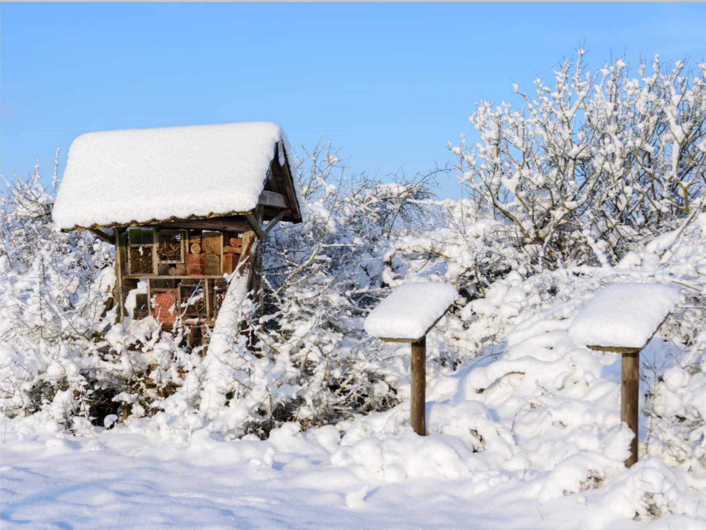
Energetisch perfekt isoliertes Insektenhotel