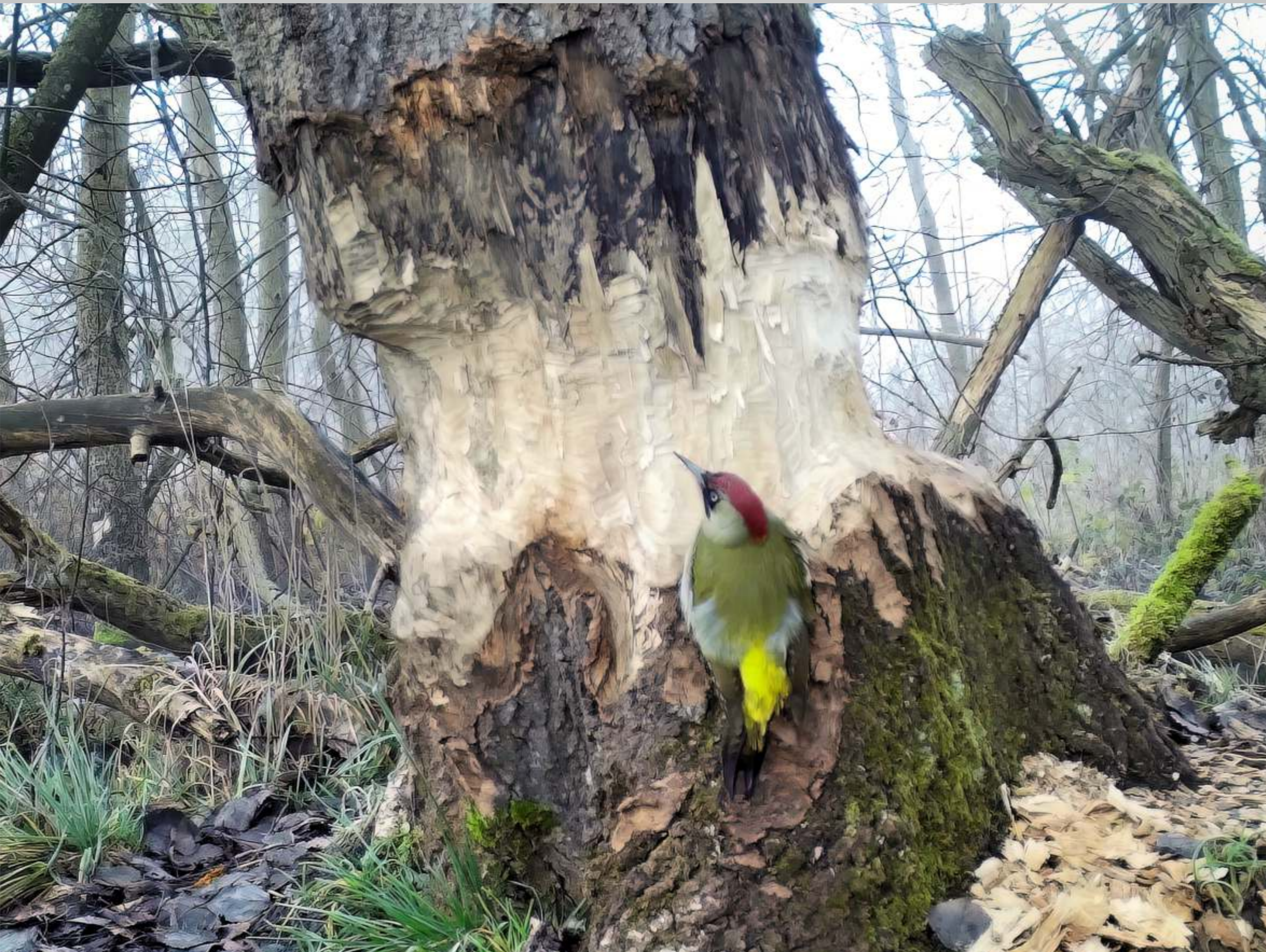
Grünspecht bewundert Biber-Werk im Reichswald-Gebrüch