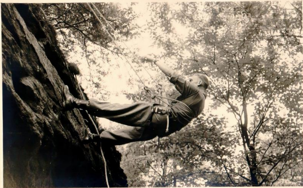
Wettkampf im Bergsteigen