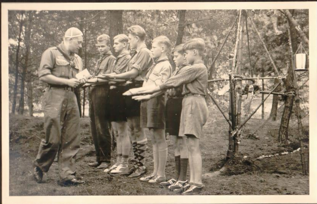
Der Lagerführer beim Appell