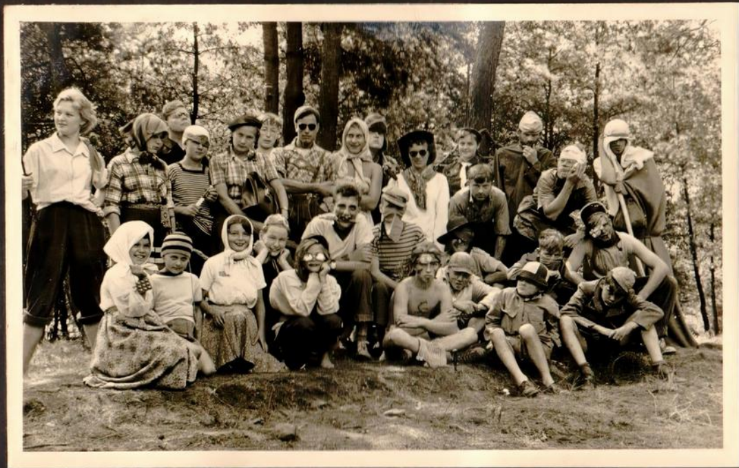
Die Teilnehmer von Verkleidungswettbewerb