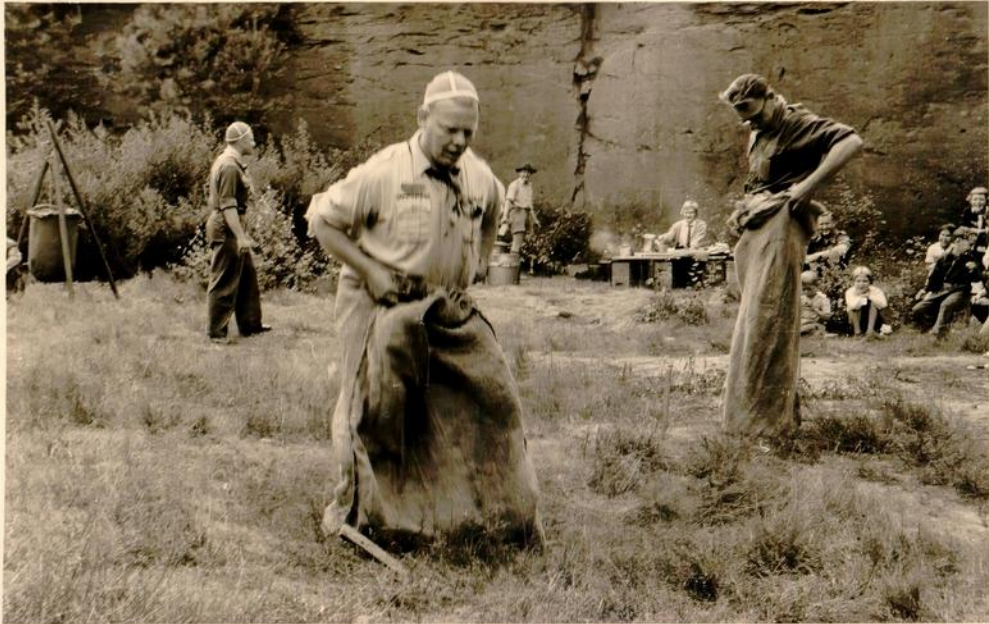
Wettlaufen im Sack