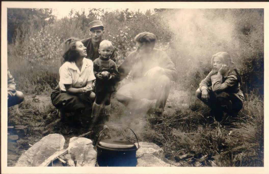
In Erwartung auf das erste Abendbrot