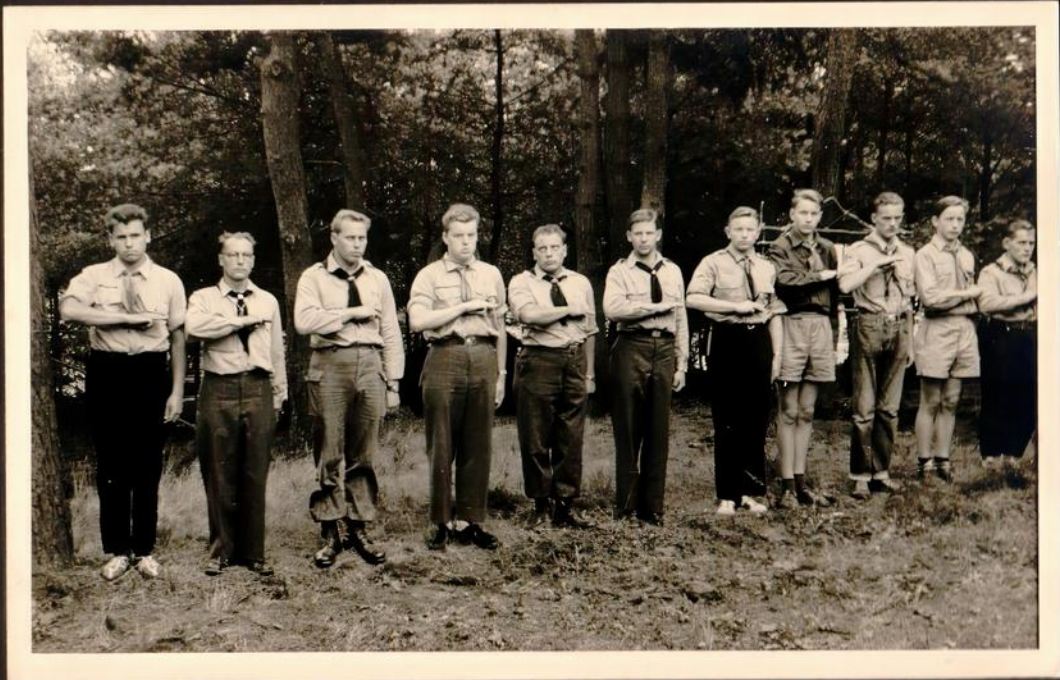
Die Junges beider Schlußfeier