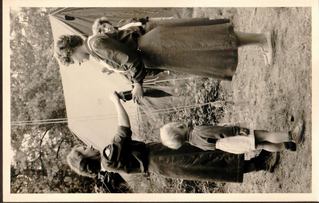
Eine Auszeichnung für die beste Mädchengruppe