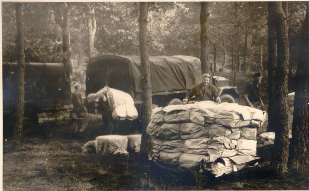
Die Lagerausrüstung ist angekommen.