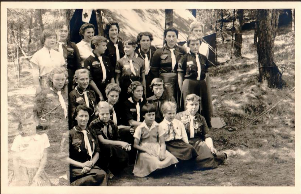
Die Einwohner vom Mädchenlager