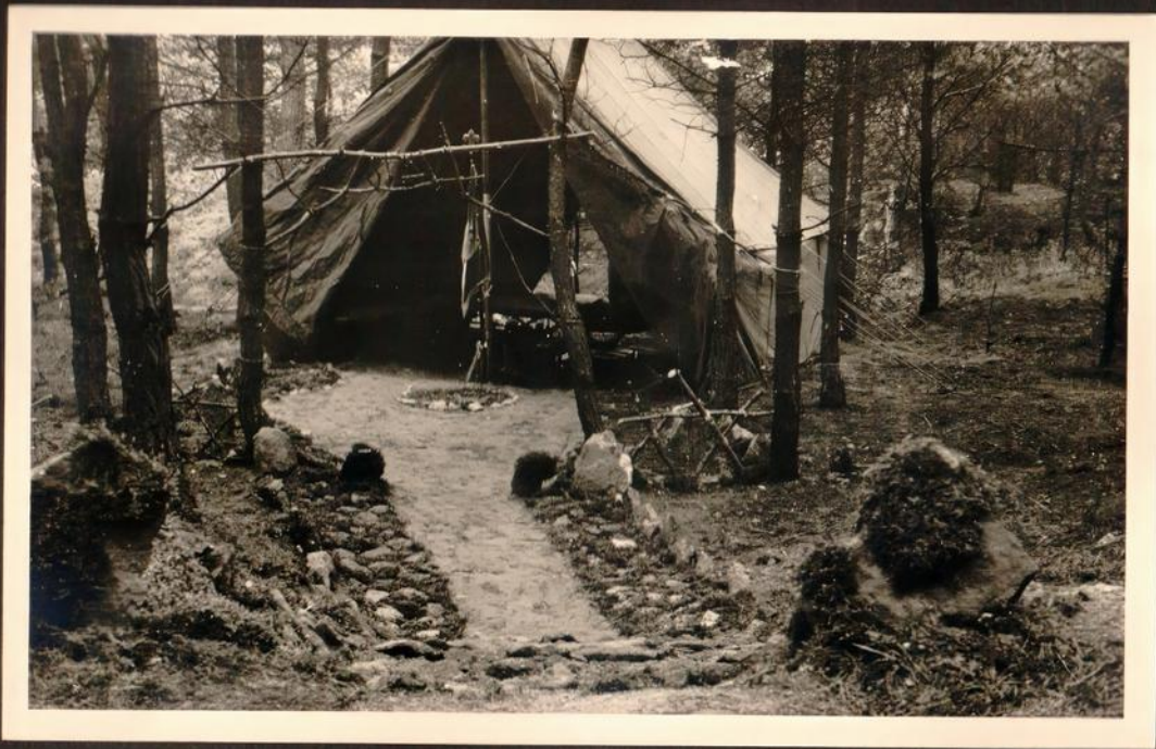
Da waren "die Oldenburger" "zu Hause"