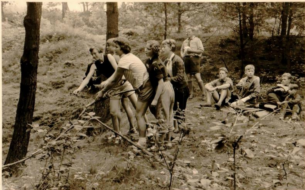
Eine Mädchengruppe beim Wettspiel