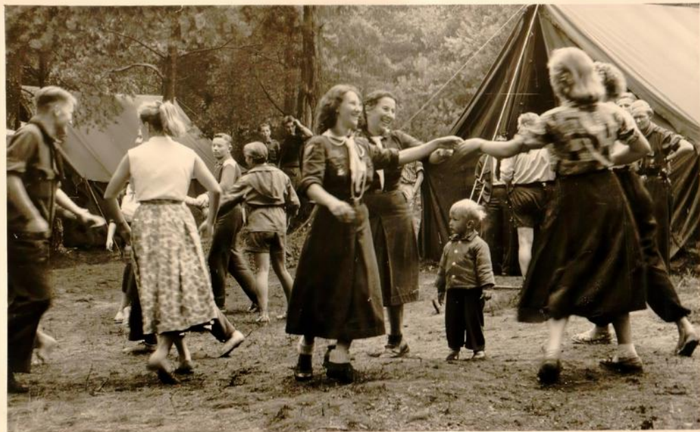
Ein estnischer Volkstanz