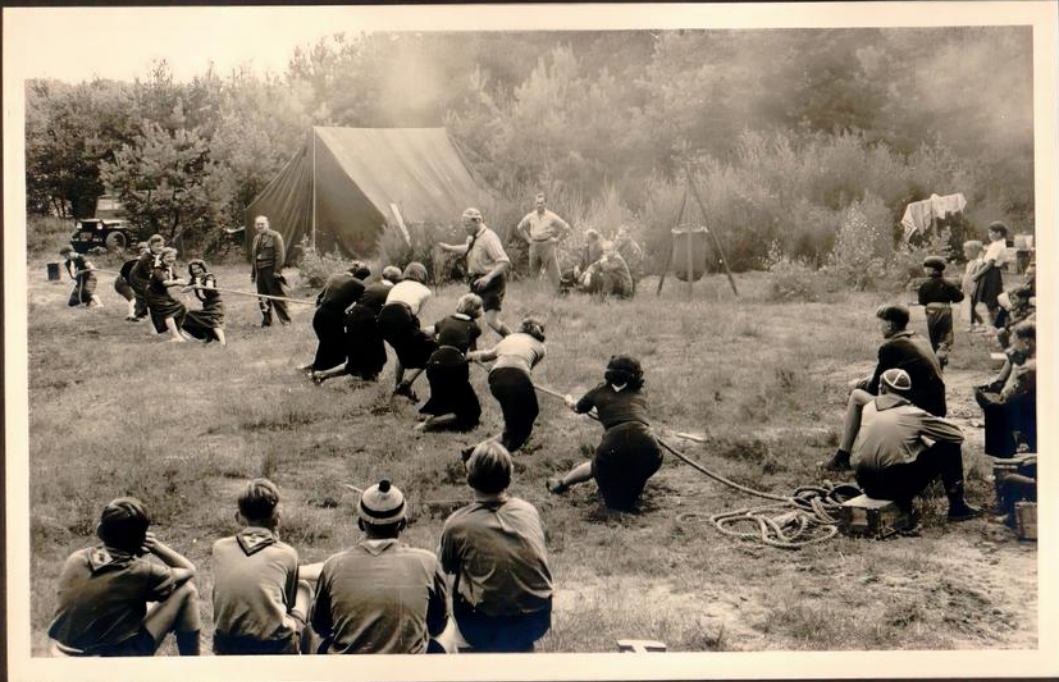
Tauziehen der Mädchen