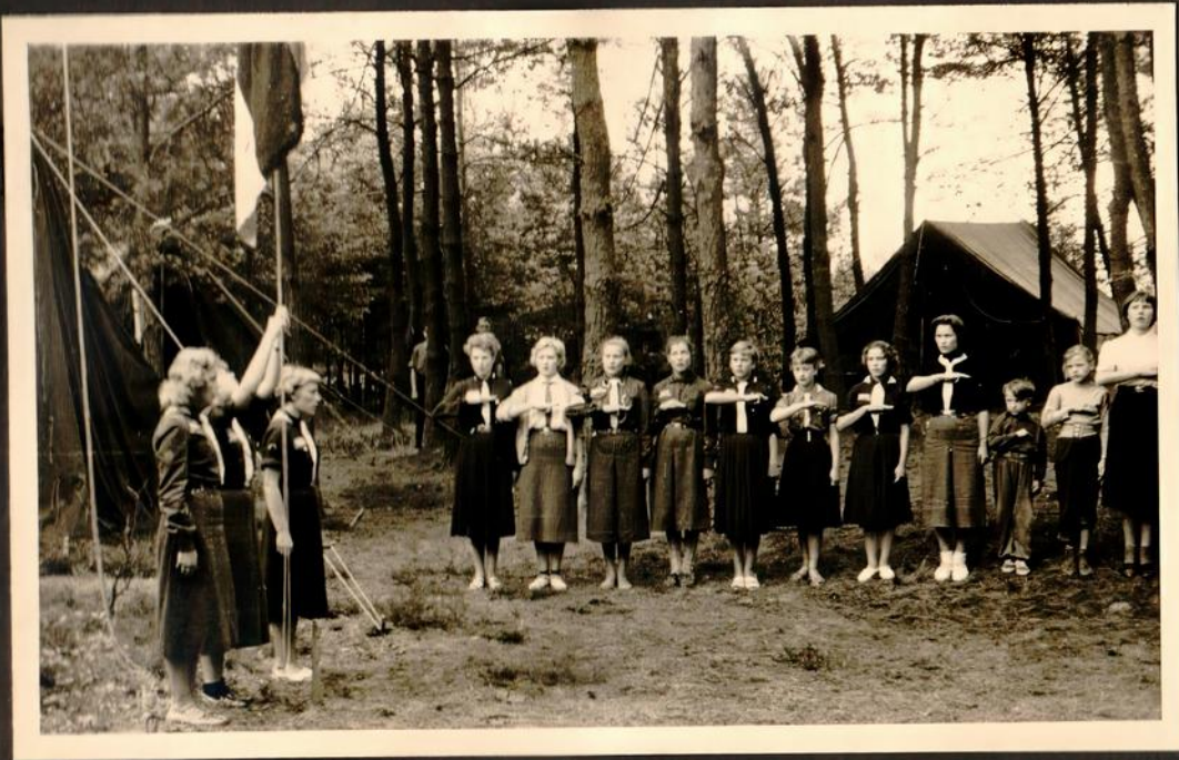
Die Mädchen bei der Eröffnungszeremonie