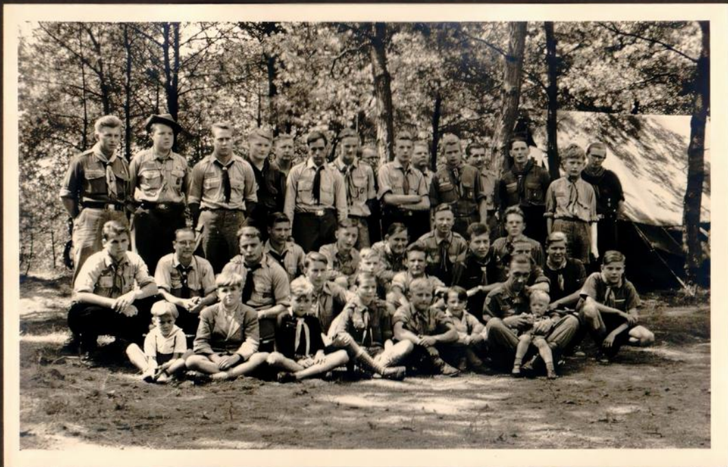
Die estnischen Pfadfinder im Zeltlager