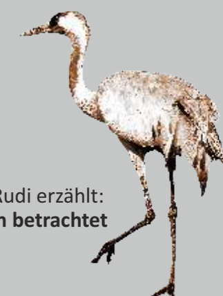
Kranichwoog bei Sonnenaufgang

Kranich Rudi erzählt: Von oben betrachtet