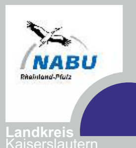
Kraniche rasten am Woog