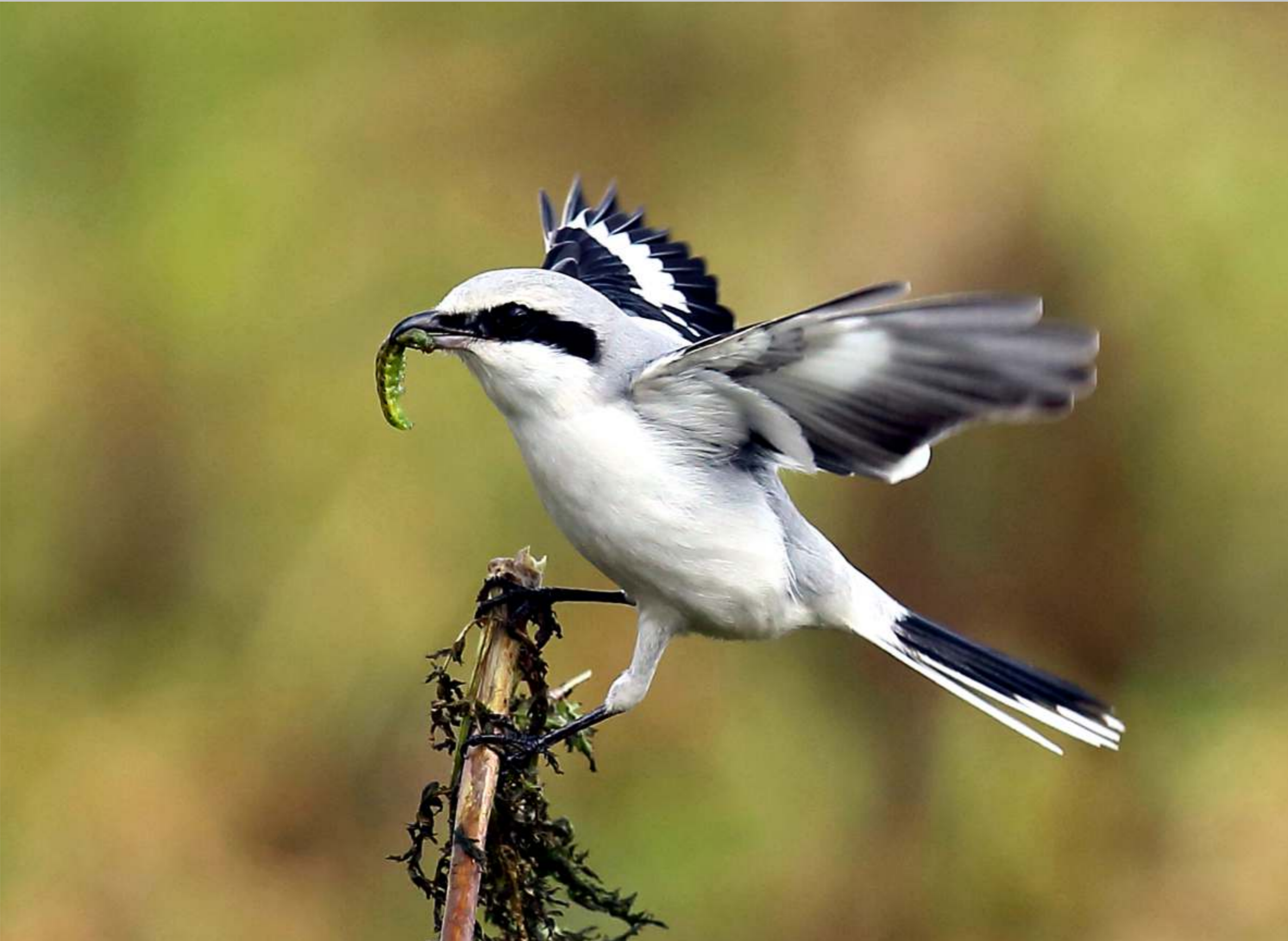
Raubwürger, Wintergast