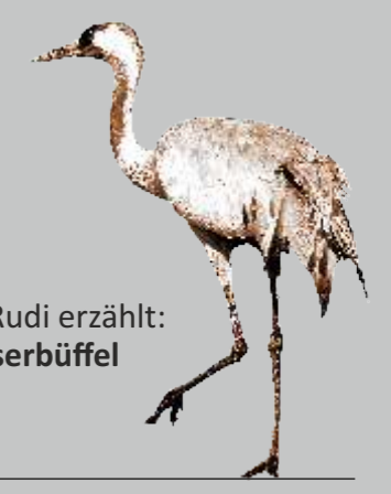
Kranich Rudi erzählt: Die Wasserbüffel