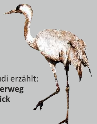
Rotschenkel, Zugvogel bei der Rast

Kranich Rudi erzählt: Der Wanderweg im Überblick