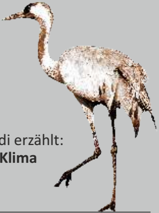
Kranich Rudi erzählt: Moor und Klima

Entlang des NATURA 2000-Wanderwegs geben Hinweistafeln Einblicke in die Besonderheiten vor Ort. Kranich Rudi begleitet die Wanderer auf dem gesamten Weg. Auf unterhaltsame, witzige und spannende Weise erzählt er von früher und von heute. Hier kann man von Kalenderblatt zu Kalenderblatt noch einmal jede seiner Geschichten hören. Viel Spaß dabei!