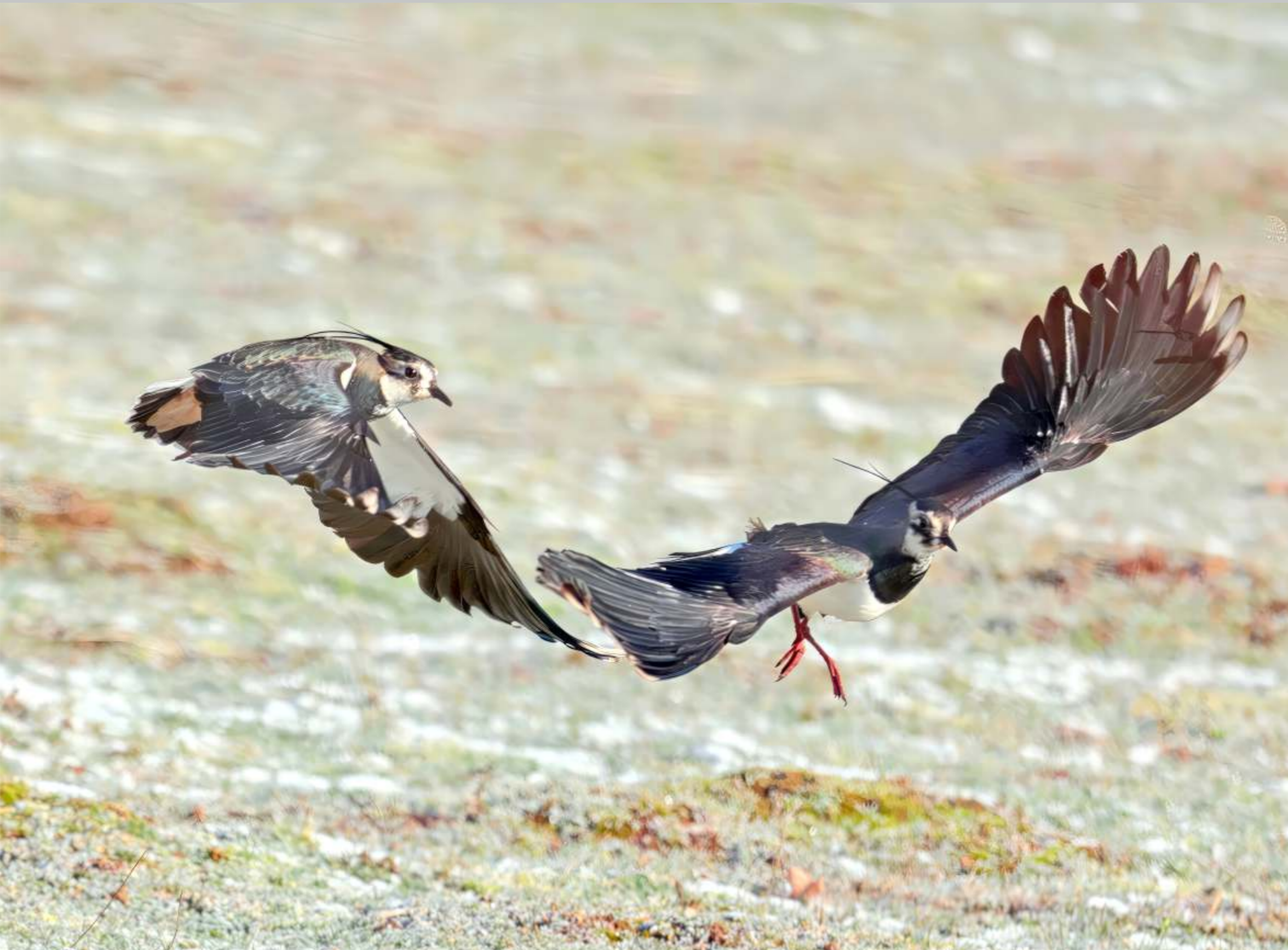
Kiebitze, Zugvögel bei der Rast