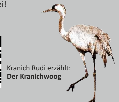
Kranich Rudi erzählt: Der Kranichwoog